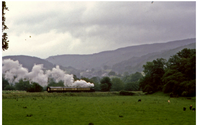
De toeristentrein Carrog naar Llangollen