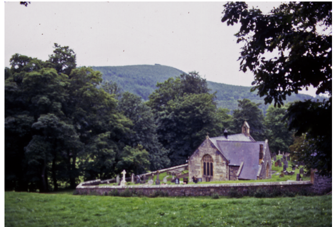
Llansylio church op weg naar Llangollen

Ik laat Bala links liggen en ga op weg naar Llangollen naar de jeugdherberg. Rond 12 uur ben ik in Llangollen. Ik neem een kijkje op het station waar een toeristische lijn wordt onderhouden met locomotieven onder stoom. Het is een mooi authentiek station. Vlak daarbij is het centrum en zoek ik een bakker met koffiesalon. Dat is genieten van de warmte en de koffie. Het is druk en ik deel mijn tafel met een ouder echtpaar, dat per auto Wales aan het verkennen is.